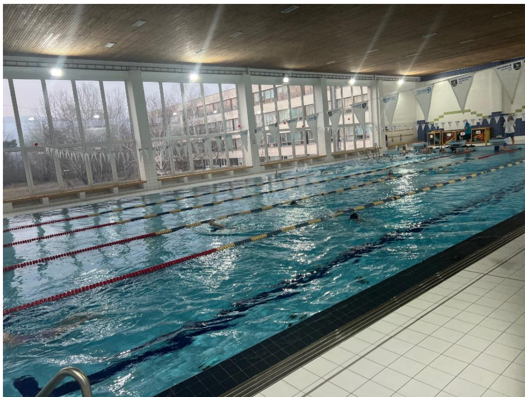
Obrázok 1 Plavecký bazén