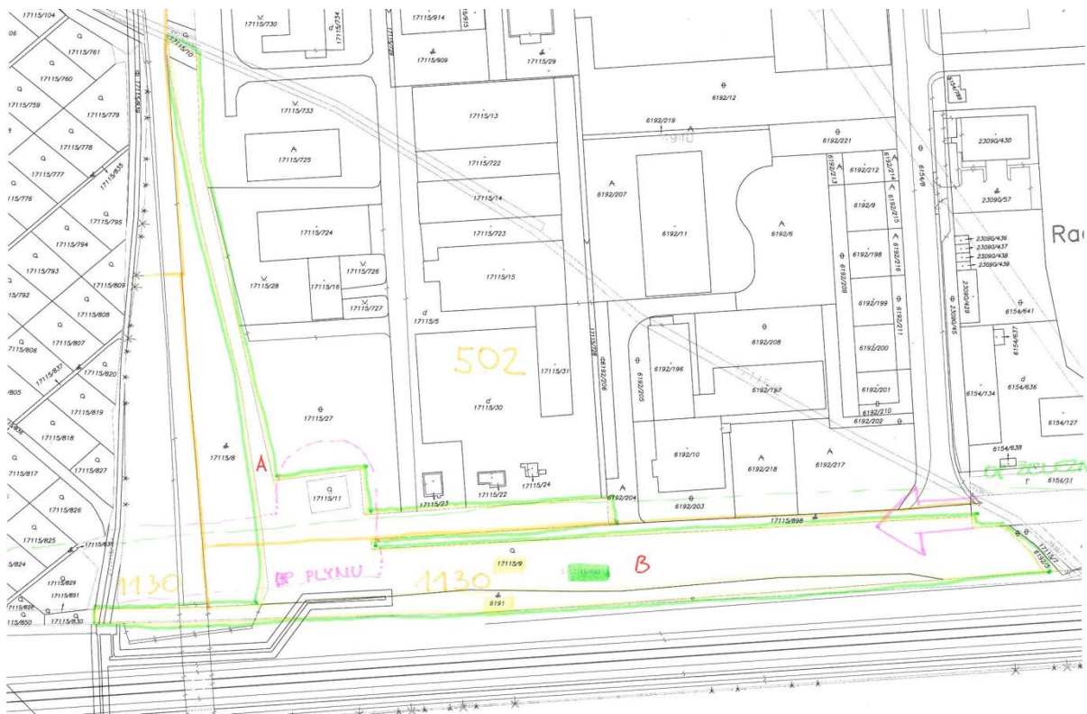
Územný plán hl. mesta SR Bratislavy, rok 2007 v znení zmien a doplnkov, výkres: Komplexný návrh

Snímka z katastrálnej mapy pozemkov v lokalite Staviteľská s vyznačením ochranného pásma dráhy železníc (tenkou zelenou prerušovanou čiarou), bezpečnostného pásma VTL plynovodu (ružová prerušovaná čiara), ochranného pásma stavby BVS (pred odčlenením pozemkov geometrickým plánom)