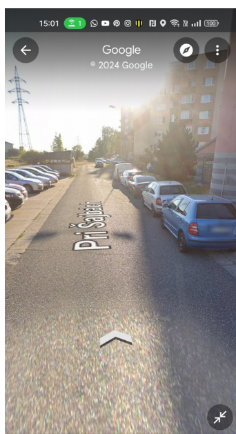
30 Pri Šajbách