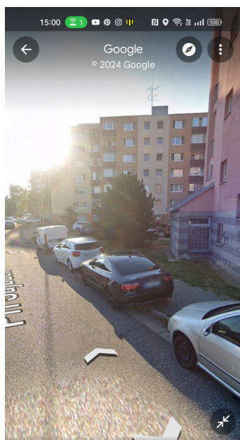
32 Pri Šajbách

Fotografie a situácia na mieste, kde by mohli byť vyznačené parkovacie miesta.