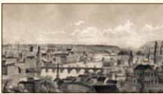
Praha Schaler, litografia, 1860