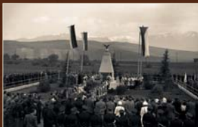
Celoštátne oslavy 100. výročia Žiadosti slovenského národa v Liptovskom Švätom Mikuláši pri pamätníku v Ondrašovej. Foto: archív TASR, autor L. Tarkoš, 24. mája 1948