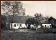
Bývalá Veštíkova horiareň pri Modre s pamätnou tabuľou, z ktorej tamojší horár previedol Štúra do Jablonového.