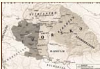
Uhorsko v 11. storočí