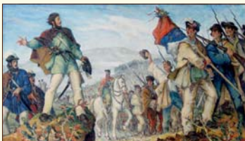
Slovenskí dobrovoľníci v septembri 1848 Martin Benka, olejomalba na plátne, 1955 - 1956, SNM v Martine