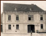
Schnellovský dom v Modre, v ktorom Ľ. Štúr býval v podnájme v rokoch 1851 - 1855.