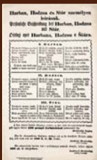
Zatykač na Hurbana, Hodžu a Štúra vydaný uhorskými úradmi leták, máj 1848