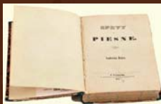
Spevy a piesne Ľudovíta Štúra Bratislava 1853

Sústredil sa na vedeckú a spisovateľskú činnosť, ktorej výsledkom boli tri významné diela: kniha básní Spevy a piesne, spis O národných povestiach a piesňach plemien slovenských a politologické dielo Slovanstvo a svet budúcnosti, ktoré prvýkrát vyšlo v Moskve v roku 1867. V ňom Štúr analyzoval tendencie európskeho vývoja, podrobil ostrej kritike Západ a vykreslil budúci vývoj, v ktorom bude podľa neho hrať rozhodujúcu úlohu Slovanstvo na čele s Ruskom.