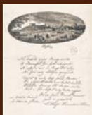
List Ľudovíta Štúra ruskému literárnemu vedcovi I. I. Sreznevskému z roku 1842