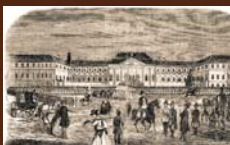
Rozpuštie slovenských dobrovoľníkov 21. novembra 1849 v Bratislave Pauliny-Tóth, Viliam - drevoryt v časopise Sokol, roč. I, 1862