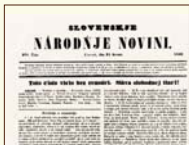
Slovenské národné noviny s článkom o zrušení cenzúry, 21. marec 1848