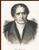
Ján Kollár Najväčší kritik Štúrovej slovenčiny