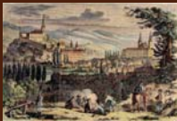
Nitra v revolučných rokoch 1848 - 1849 Dobová litografia, Pontrianske múzeum Nitra