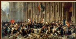
Minister Lamartine odmieta 25. februára 1848 pred parížskou radnicou červenú vlajku. Autor Henri Félix Emmanuel Philippoteaux