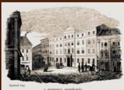
Budova uhorského snemu v Bratislave dobová ilustrácia, 1844