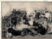
Revolúcia v rokoch 1848 - 49 si vyžiadala životy mnohých slovenských dobrovoľníkov.