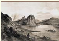
Hrad Devín Ludwig Rohbock - Gustav Georg Lange (1860), tlač/ oceľotvina na papieri