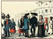
Slováci, Nemci, Maďari a Chorváti v Bratislave Kolorovaná litografia, 1847.

Základy československej literárnej a národnej jednoty naplno rozvinul ďalší evanjelický predstaviteľ Ján Kollár svojim básnickým dielom Slávy dcéra a rozpracovaním koncepcie slovanskej vzájomnosti a vízie budúcnosti Slovanov. Veľký význam pre národný vývin Slovákov mali jeho zborníky slovenských ľudových piesní Národné spievanky.