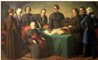
Zakladanie Slovenského učeného tovaríšstva (Andrej Kováčik, 1934) V strede Anton Bernolák, sediaci Alexander Rudnay, mecenáš bernolákovcov a budúci kardinál, vpravo Jozef Ignác Bajza a Juraj Fándly.