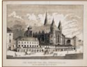
Dóm sv. Štefana vo Viedni Neďaleko od neho bolo miesto náboru slovenských dobrovoľníkov. Litografia, 1853