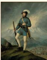
Janko Francisci ako dobrovoľnícky kapitán Bohún, Peter Michal - olej na plátne, 1848 - 1849, Slovenská národná galéria