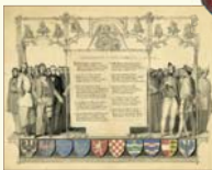
Diplom Slovenského zjazdu v Prahe, vŕavo Ľudovít Štúr Litografia Josefa Hellicha s básňou Václava Hanku, 1848