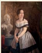
Ľudovít Štúr J. Vidéky, 1876 SNM Martin