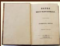
Nauka reči slovenskej