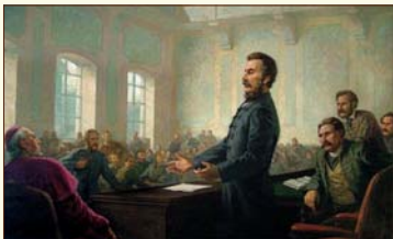
Ľudovít Štúr vystupuje na uhorskom sneme Gejza Szalay, olejomalba na plátne, 1950, SNM-Historické múzeum

Slovenské národné noviny začali vychádzať 1. augusta 1845, dvakrát v týždni. Raz za dva týždne k nim vydávali literárnu prílohu Orol tatránski.