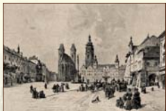
Hradec Králové 2. polovica 19. storočia