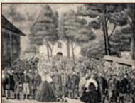
Memorandové zhromaždenie v Martine v júni 1861 dobová litografia