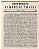
Slovenské národné noviny a Orol tatránski