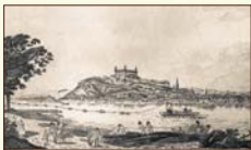
Bratislava koncom 18. storočia. kolorovaný lept J. Janscha podľa kresby bratov Schafferovcov, 1787. SNM-Historické múzeum