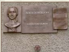
Pamätná tabuľa Obecný úrad na Ostrej Lúke autor: Marián Polonský, 2014