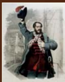
Vodca maďarskej revolúcie Lúdvít Košút Dobová kolorovaná litografia, apríl 1848, SNM-Historické múzeum