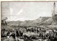
Cisárske vojsko pri Košiciach v decembri 1848 dobová litografia