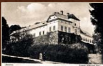
Zámok grófa Zaya v Uhrovci