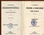
Ľudovít Štúr O národných piesňach a povestiach plemien slovenských Praha 1853