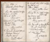
Denník Viliama Paulíny-Tótha Najstarší zápis textu piesne Janka Matušku Nad Tatrou sa blýska 1844 SNK - Literárny archív Martin