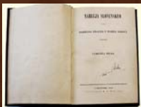
Narečja slovenskua alebo potreba písania v tomto nárečí