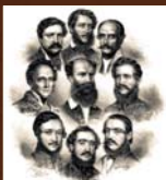
Prvá uhorská vláda v roku 1848 dobová litografia