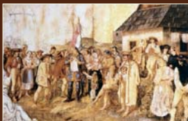
Čítanie marcových zákonov na ľudovom zhromaždení Peter Michal Bohúň - tempera, 1848, SNM v Martine