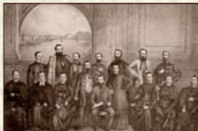
Členovia delegácie, ktorí predložili Memorandum národa slovenského Uhorskému snemu.

Ľudovít obľuboval vychádzky do Holomebeckej doliny v chotárnej časti Modry, kde stál mohutný gaštan. Na poslednú poľovačku sa vybral pred Vianocami 1855 do chotára Šnaudy. Pri preskakovaní priekopy spadol, puška vystrelila a broky mu vnikli do ľavého stehna. Zraneného Ľudovíta previezli do emreszovského domu ku švagrinnej, kde prežíval vo veľkých bolestiach tri týždne. 12. januára 1856 zomrel na otravu krvi. Pohreb Ľudovíta Štúra bol dôstojný a slávnostný. Pochovaný je na cintoríne v Modre vedľa brata Karola a kňaza Pavla Zocha.