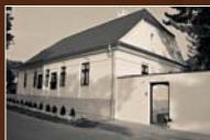
Hurbanova fara v Hlbokom, kde vznikla 11. - 16. júla 1843 dohoda o vytvorení spisovného slovenského jazyka.

Dalším strategickým cieľom Štúra bolo vydávanie slovenských politických novín. Na vydanie povolenia bolo potrebné zložiť vysokú kauciu a podriaďiť sa cenzorským obmedzeniam. Podarilo sa mu ho získať až na základe žiadosti adresovanej v januári 1845 priamo panovníkovi Ferdinandovi I.