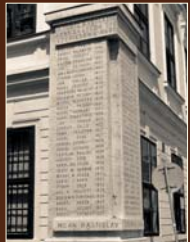
Významní študenti Evanjelického lýcea v Bratislave