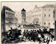
Povstanie v Prahe v roku 1848

Slovenské povstanie v septembri 1848 bolo v dôsledku nedostatočnej organizácie a výzbroje potlačené. Napriek porážke malo veľký historický význam. Slováci dokázali, že vedia bojovať za svoje práva a vlastnú štátnosť.