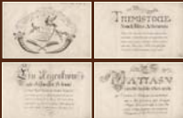
Školská písanka 14-ročného Ľudovíta Štúra Krasopis z latinčiny, nemčiny, maďarčiny z rokov 1827- 1829