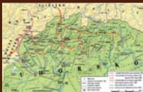
Mapa výprav slovenských dobrovoľníkov v rokoch 1848 - 1849 Ottov historický atlas - Slovensko, Praha 2009