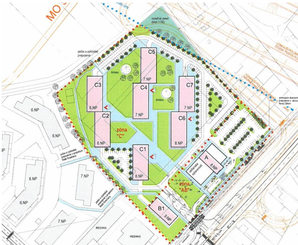
Obrázok č. 3: Zadanie urbanistickej štúdie Nový záhon, Bratislava-Rača, august 2017, situačný výkres predbežného urbanistického návrhu

Podlažnosť okolitej zástavby: z juhozápadu riešeného územia je 9.NP (Reding – objekty občianskej vybavenosti), 6.NP (Malé Krasňany) a zo severovýchodu je 7.NP (Krasňany – bytové domy).