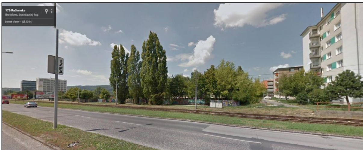
Obrázky č. 4 a 5: uličné pohľady na rozvojové územie a okolitú zástavbu z komunikácie Račianska

Územie pôvodného výrobného areálu spoločnosti AB Kozmetika je podľa územného plánu mesta zo severovýchodu dotknuté plánovanou dopravnou stavbou vo verejnom záujme, definovanou v kapitole územného plánu mesta C.16. Verejnoprospešné stavby pod označením: D8 – „Prestavba Bojníckej ulice v úseku Rožňavská – Vajnorská vrátane mimoúrovňovej križovatky s Ivanskou cestou a výstavba v úseku Vajnorská – tunel pod Karpatami – Lamačská“ ( Vonkajší polookruh Lamač – Galvaniho ulica ). Potrebný záber pozemkov mimoúrovňovej križovatky s komunikáciou Račianska vyplynie až z riešenia kladne prerokovaného územnoplánovacieho podkladu, ktorého návrh bude zdôvodnený kapacitným výpočtom.