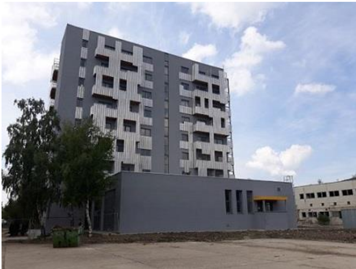
Obrázok č.7 Administratívna budova Archívnej a registratúrnej agentúry s.r.o. – predmet zmeny funkcie v platnom územnom pláne

Považujeme blízkosť dopravných železničných uzlov (železničné stanice BA-Vinohrady a BA-Predmestie) za dôležité s logickou požiadavkou využitia územia v ich okolí na zabezpečenie pracovných miest s dobrou dopravnou dostupnosťou. Umiestnenie bytov v tomto území nepovažujeme za vhodné. Mestská časť Bratislava-Rača nesúhlasila ani s overovaním zmeny funkcie administratívnej budovy spoločnosti YIT Slovakia a.s., kde mesto malo záujem umiestniť nájomné bývanie.