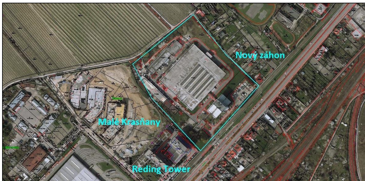
Obrázok č. 2: Bývalé vymedzenie územia pre riešenie urbanistickej štúdie, výmera cca. 4,3 ha