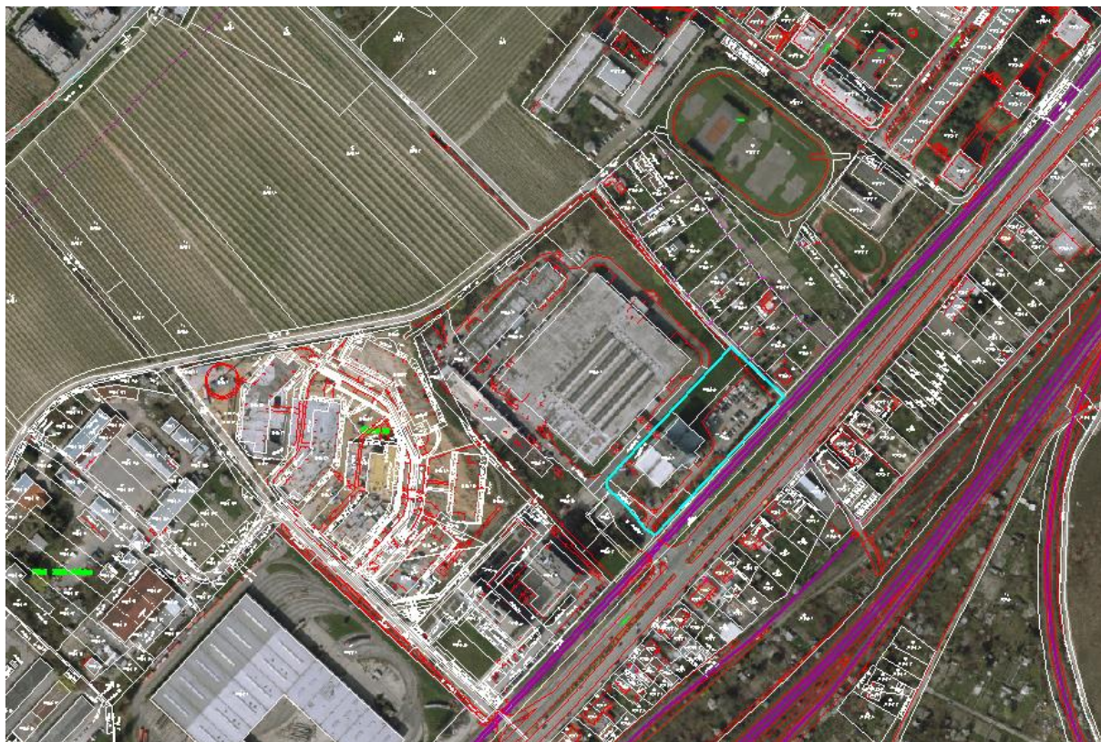
Obrázok č. 1: Vymedzenie územia pre riešenie urbanistickej štúdie, výmera cca 0,8068 ha

Predkladaný návrh zadania na spracovanie urbanistickej štúdie špecifikuje plochu s pozemkami parc.č. 17400/2, 17400/6, 17400/26, 17400/27 a 17400/28 CKN, k.ú. Rača na overenie zmeny funkcie platného územného plánu